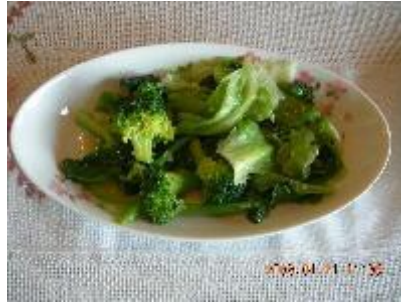
季節野菜ニンニク炒め