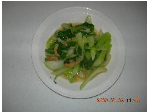
季節野菜干しえび炒め