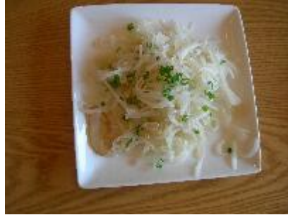
大根とくらげのさっぱり和え