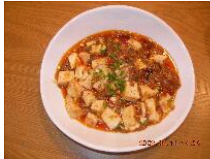
本番四川マーポ豆腐