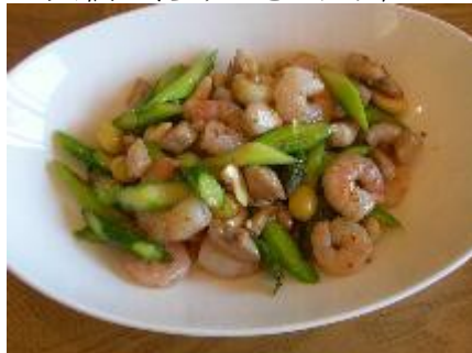
鶏肉と木の実の海鮮炒め