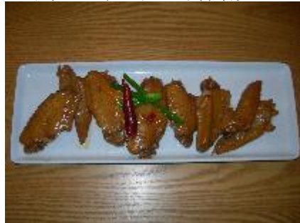
四川風香味手羽先煮る